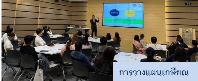
การวางแผนเกษียณ