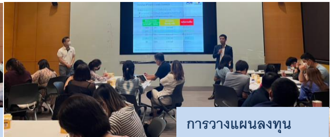
การวางแผนลงทุน

เมื่อวันที่ 5 สิงหาคม 2566 สมาคมนักวางแผนการเงินไทยจัดกิจกรรม Workshop วางแผนการเงินกับนักวางแผนการเงิน CFP® ครั้งที่ 2/2566 เปิดให้ผู้สนใจได้เรียนรู้เรื่องการวางแผนการเงินผ่านเวิร์คช็อป ในหัวข้อการวางแผนการลงทุน การวางแผนประกันภัย การวางแผนภาษี และการวางแผนเกษียณ มีนักวางแผนการเงิน CFP 23 คน และผู้สนใจ 107 คน เข้าร่วมกิจกรรม ณ อาคารตลาดหลักทรัพย์แห่งประเทศไทย