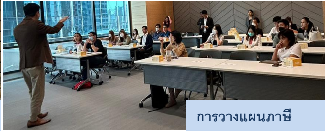
การวางแผนภาษี